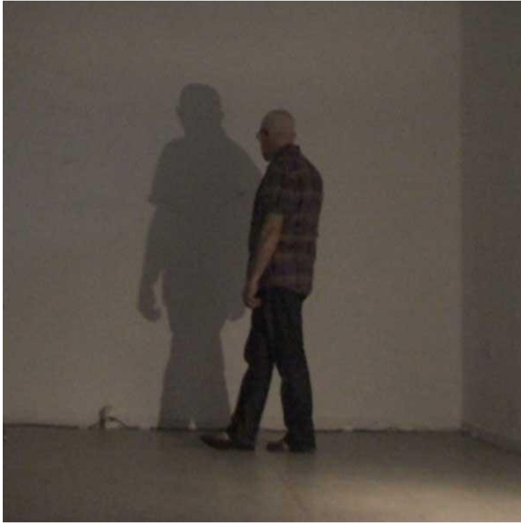
La instalación, tal y como se presentó en El Foro.