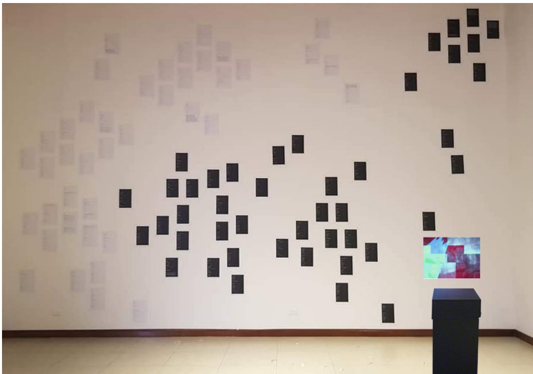
2021: En la exposición La Singularidad Plural realizada en La Galería Nacional de San José de Costa Rica.